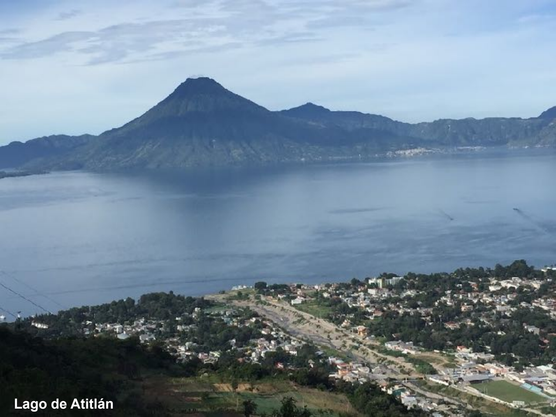
Lago de Atitlán