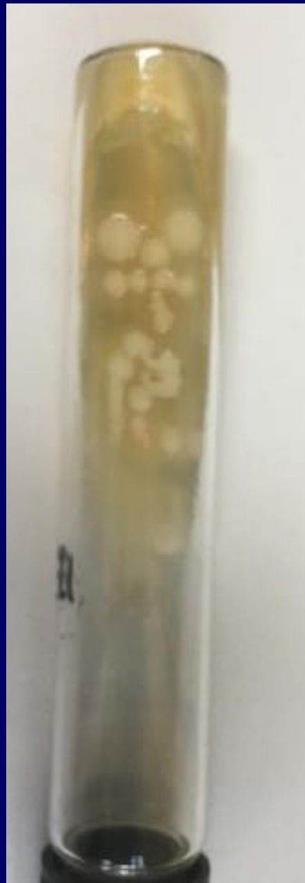
Cultivo de Malassezia furfur en Agar Sabouraud más aceite de oliva