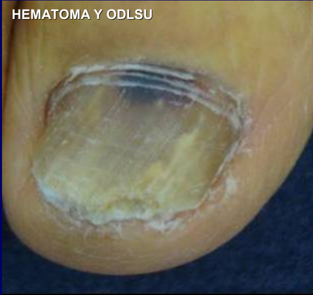
HEMATOMA Y ODLSU