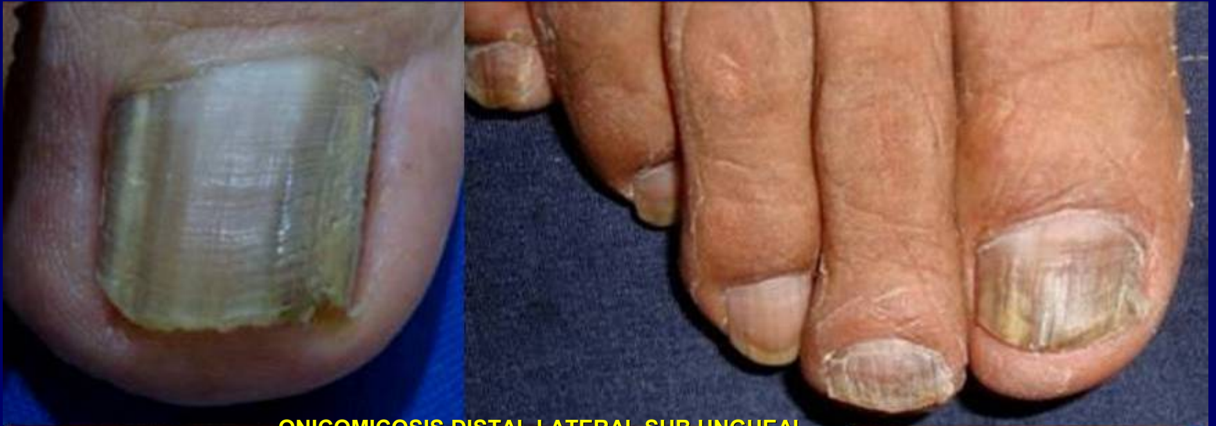
ONICOMICOSIS DISTAL LATERAL SUB UNGUEAL