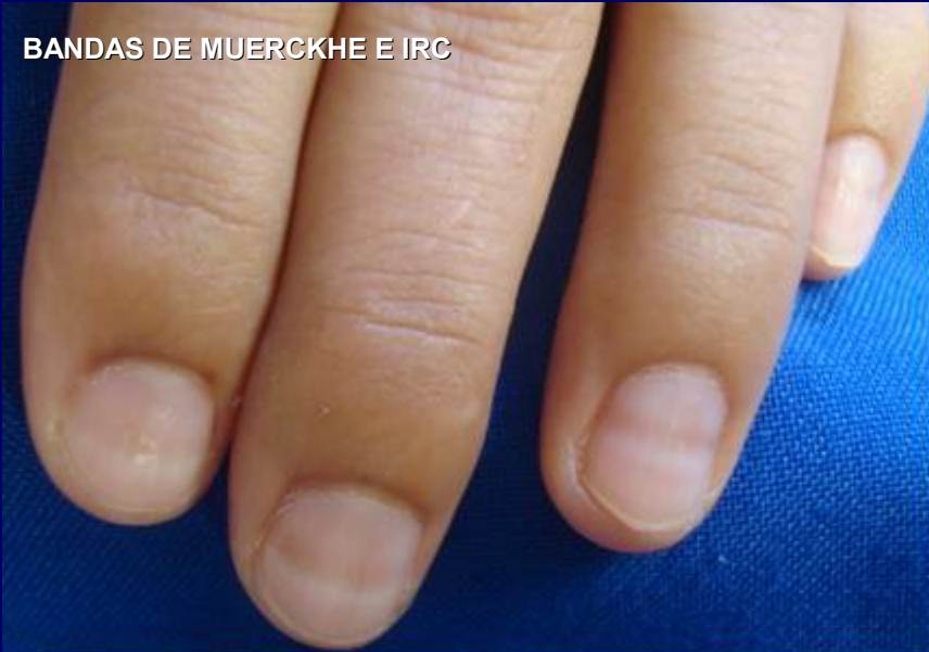
BANDAS DE MUERCKHE E IRC