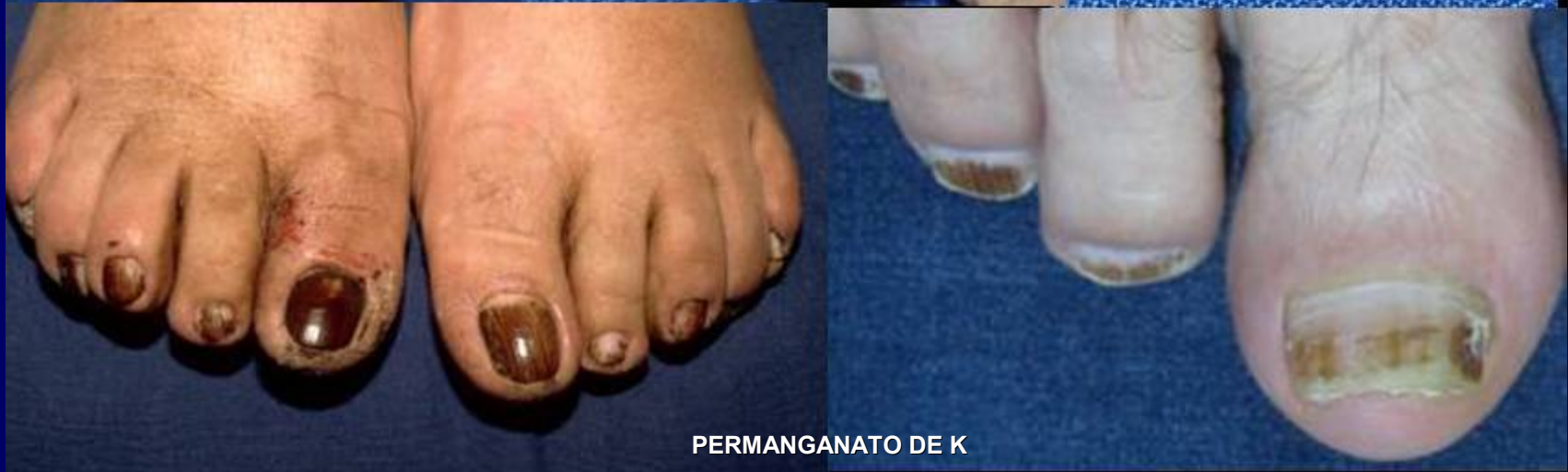
PERMANGANATO DE K