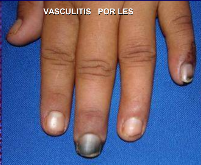
VASCULITIS POR LES