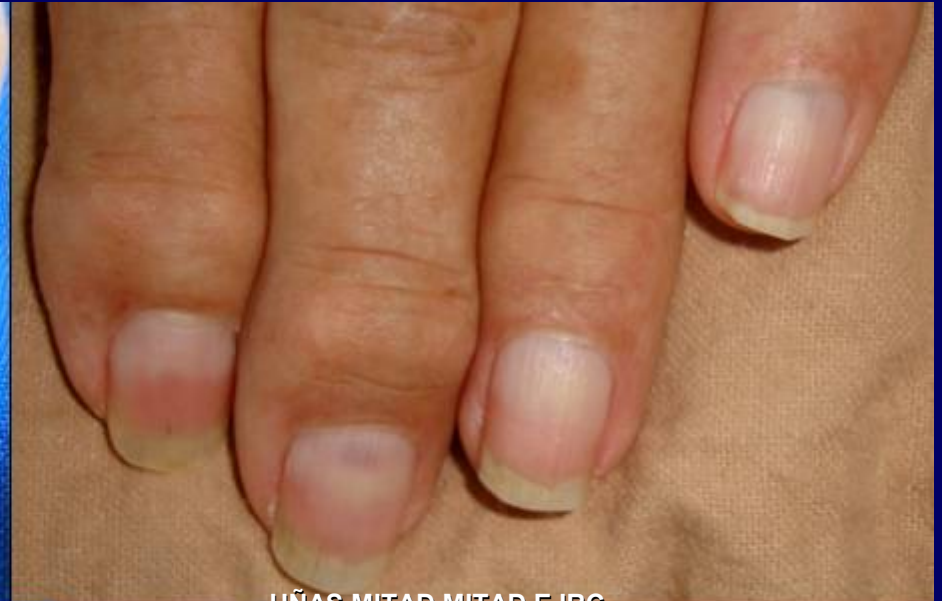
UÑAS MITAD MITAD E IRC