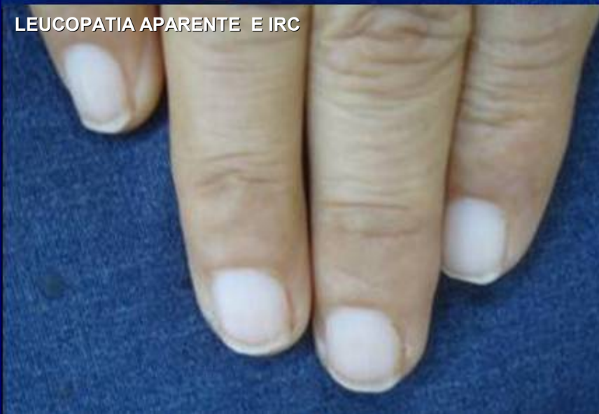
LEUCOPATIA APARENTE E IRC