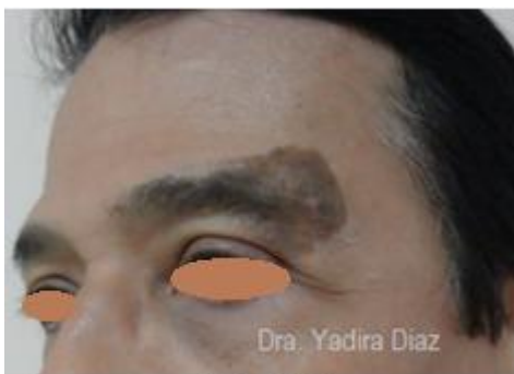
Foto N°1 Antes

Paciente con diagnóstico de Queratosis Seborreica sobre Lentigo Solar , dos biopsias previas, se decide tratamiento con Erbium – Yag 2940 nm (sp /450mJ/3mm/7 hz) una sola sesión (foto N°3) y se le explica que habrá pérdida temporal del pelo de la ceja (fotoN°5)